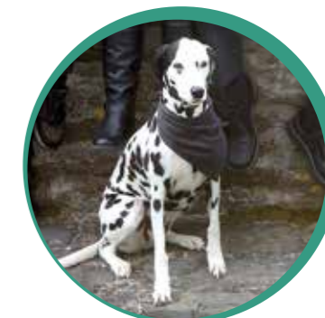
Fee, gute Seele.